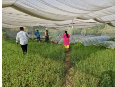
Der Gemüseanbau benötigt nur geringen Landbedarf, hat kurze Wachstumszyklen, eine hohe Nachfrage auf lokalen Märkten und dient auch der Selbstversorgung.