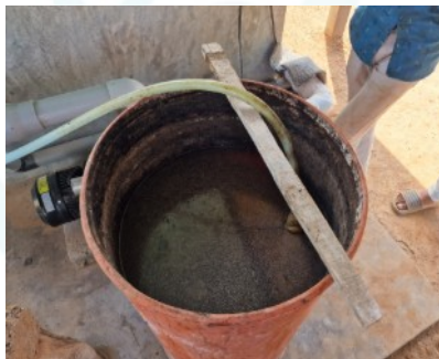
Bauern erhalten Förderung für die Umstellung auf organischen Dünger. Über die Menge der Düngung beraten die Field Officer.