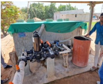
Pumpen befördern Grundwasser zu den Verteilern der Tropf-Bewässerungsschläuche. Flüssigdünger kann zugeschaltet werden.