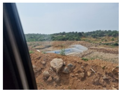
Normalerweise wird durch den Regen von Juni bis September das Wassersammelbecken gefüllt. 2023 fiel der Regen aus. Ohne Tropfbewässerung keine Ernte, kein