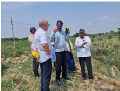
Indien unternimmt große Anstrengungen mit dem Bau von Wasserauffangbecken, um Dürreperioden zu überbrücken.