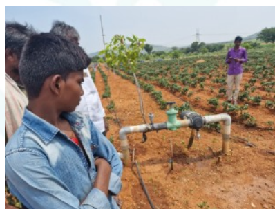
Mit einem Boden-Monitoring-System kann die Bewässerung exakt an den Bedarf der Pflanzen angepasst werden.