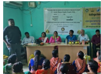
Um weiteres Einkommen zu generieren, werden die Bäuerinnen in der Herstellung von Honig geschult.