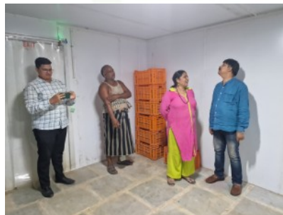
Bei +4°C können die Bauern ihre Ernte bis zum Verkauf aufbewahren. Ohne Kühlung würden ca. 30-40% der landwirtschaftlichen Produkte verderben.