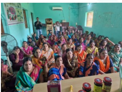
Der Frauenanteil in der Landwirtschaft liegt in Indien bei 70-80%. Sie werden ganz besonders gefördert, auch um die Geschlechterungleichheit zu überwinden.