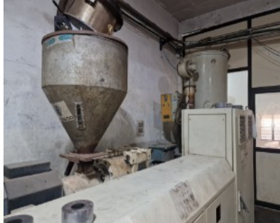
Eine ausgemusterte Fertigungsanlage der israelischen Firma NetaFim. Granulat wird eingefüllt.