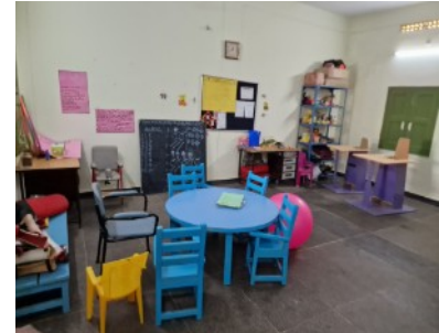
Kinder mit einer Behinderung oder Mädchen werden in Indien z.T. – häufig auf Druck des Vaters, ausgesetzt. Die Stiftung nimmt sie auf und betreut sie.