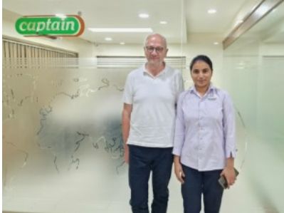
Captain Polyplast in Rajkot fertigt Tropf-Bewässerungsanlagen und baut sie auf den Felder der Kleinbauern ein.

In Rajkot bot sich die Möglichkeit, einen Hersteller von Tropf- und Mini-Sprinkler-Bewässerungsanlagen zu besuchen. Diese Bewässerungssysteme werden durch die indische Regierung für Kleinbauern mit bis zu 80 % gefördert.