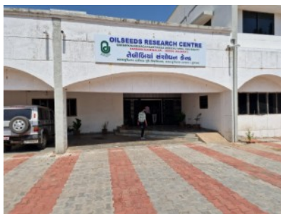
Das Ölsaat-Forschungs-Center in Ahmedabad erforscht und entwickelt Saatgut für Ölfrüchte.