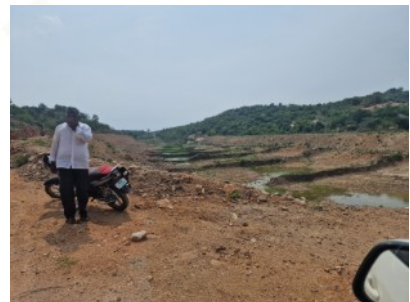
Dann fällt auch mal das ganze Jahr kein Regen und die Wasserauffangbecken trocknen völlig aus.