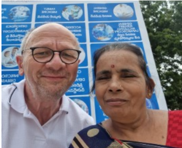
Shanta führte durch die Anlagen der Stiftung. Krankenhaus, Kindergarten, Schule, Kantine, die Betreuung der Ärmsten ist hier umfassend.

Besuch bei der Vicente-Ferrer-Stiftung in Anantapur. Besichtigung der Anlagen auf dem Campus und Besuche bei Kleinbauern der Region.