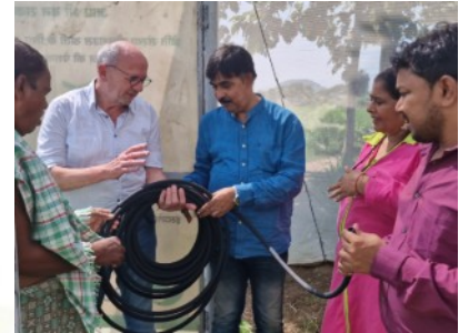
Der Perlschlauch für Unterflurbewässerung stieß auf großes Interesse. Zusammen mit einem Boden-Monitoring-System optimiert er das Pflanzenwachstum und verbessert die Bodenqualität.