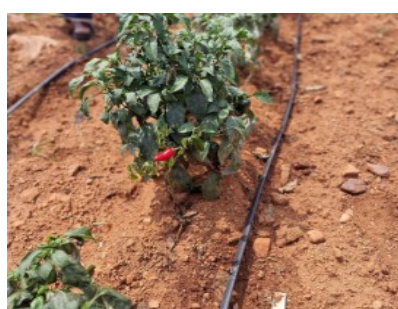
Peperoni wachsen auf wüstenähnlichem Boden, Dank der Tropfbewässerung. Sie spart bis 60 % Wasser ein.