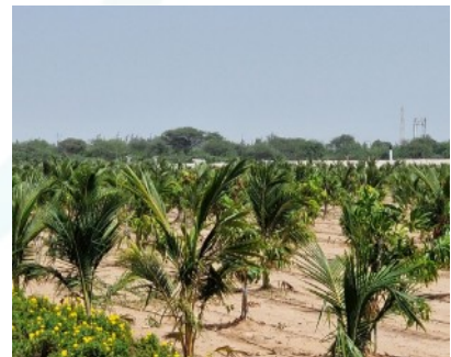
Große Bereiche von Gujarat sind wüstenähnliche Landschaften. Mit Tropf-Bewässerung kann dennoch Landwirtschaft betrieben werden.