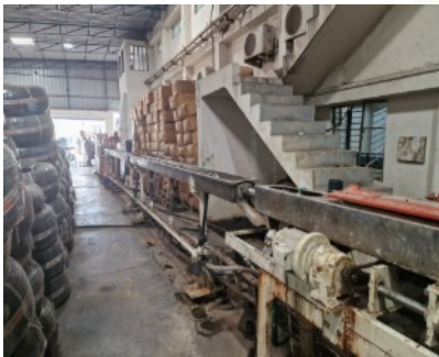
Über ein Wasserbad wird der ausgepresste Schlauch gekühlt, Löcher gestanzt und automatisch aufgewickelt.