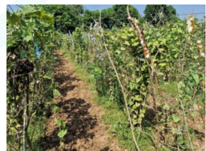
Der Bauer dieses Felds setzt Flutbewässerung ein, das zum einen viel Wasser verbraucht und zum anderen die obere nährstoffreiche Erde abträgt. Mikro-Bewässerung mit einer Kontrolle des Wasser- und Nährstoffbedarfs mit einem Boden-Monitoring-System kann die Bodenqualität verbessern, Wasser und Dünger einsparen und die Biodiversität fördern.