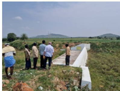
Durch den Klimawandel werden die Dürreperioden häufiger und extremer.