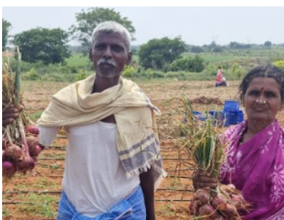
Nur mit moderner Technologie ist auch bei Dürreperioden eine Ernte möglich, die den Lebensunterhalt der Kleinbauern sichert.