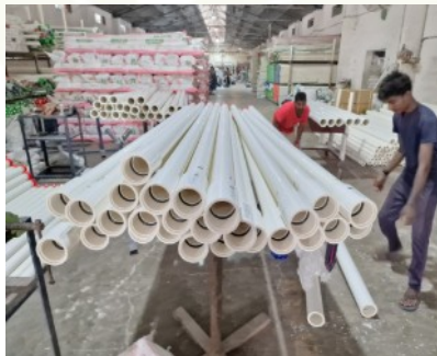
Rohre, die auf den Feldern vom Hauptanschluss zu den einzelnen Segmenten auf den Feldern führen.