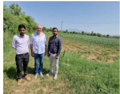
Field Officer haben eine technische und landwirtschaftliche Ausbildung. Sie beraten Kleinbauern .