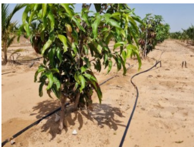
Die Drachenfrucht gedeiht auf diesem kargen Boden mit Tropf-Bewässerung.