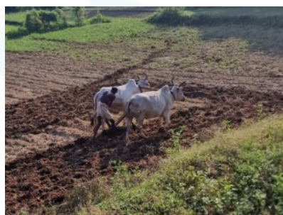
Mit einfachsten Mitteln erfolgt die Bodenbearbeitung. Die Abhängigkeit von Regen zur Bewässerung wird zunehmend schwieriger aufgrund des Klimawandels.