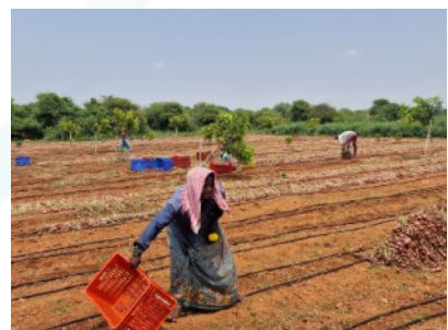
Zwiebelernte bei 35°C. Am Boden sind Tropfbewässerungsschläuche sichtbar.