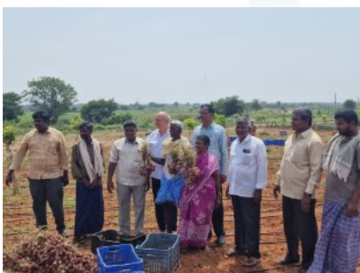
Diese Kleinbauern hatten Glück, sie wurden mit einer Tropfbewässerung durch die Regierung gefördert.