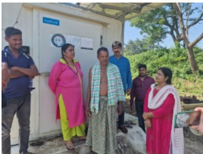
Im Kühlhaus mit autarker Energieversorgung über Solarzellen lagern die Kleinbauern ihre Ernte bis zum Verkauf zwischen.