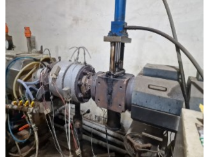
Mit hohem Druck wird das geschmolzene Granulat in eine Schlauchform gepresst.