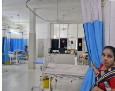
Das eigene Krankenhaus versorgt Menschen, die sonst nur schwierig Hilfe finden, aus finanziellen Gründen, oder einfach aus Scham oder Angst.