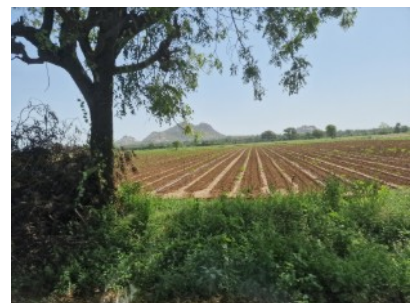
Bauern erhalten Saatgut von öffentlichen Forschungseinrichtungen und dürfen es vermehren und tauschen.